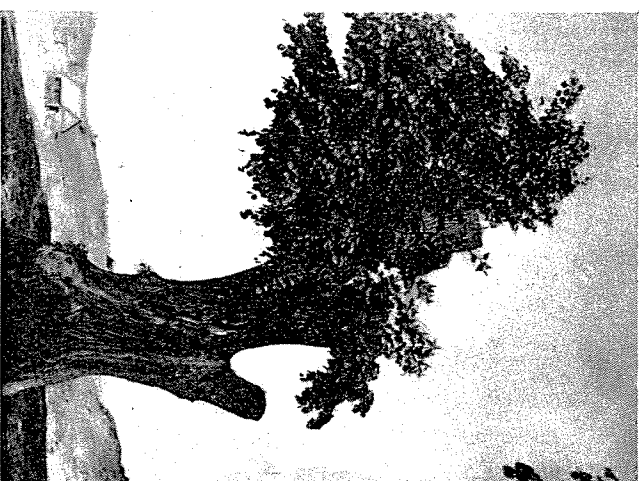
אחדת מגי תהוה לילי אחימותו של המריץ — בקצה העיר

גלויים אלה מפתחים חיים בספורי אגדות לרוב, אודות מלחמות גדולות, נכחונות ומפלות שכולם נקשרים בשמה של העיר ובגבורת אנשיה. עיר בעלת עבר היסטורי וחווה מרשים בהן ובתמימות לבבית שהיה גם הוא לעבר.